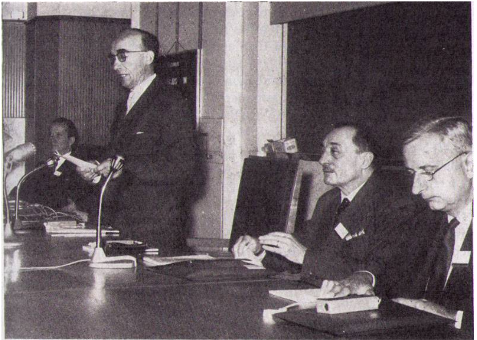
FIG. 1. — Séance inaugurale.