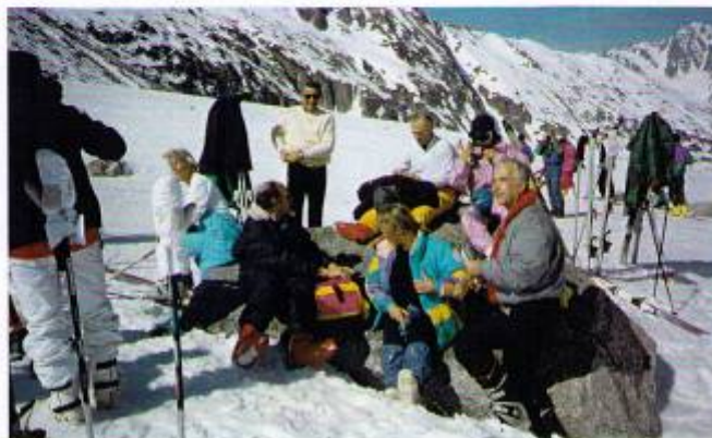
La Vallée blanche, c'est du sport Courmayeur 1990